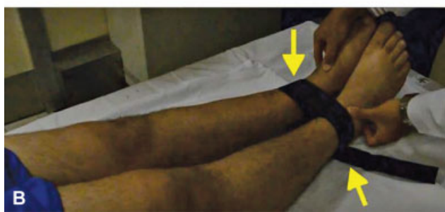
Fig. 1 O paciente é colocado em decúbito dorsal na mesa radiográfica e estende os joelhos. Os tornozelos e as coxas dos dois membros devem ficar em contato. A seguir, uma fita de Velcro (seta amarela) é usada à altura supramaleolar para manter o contato entre os maléolos mediais.