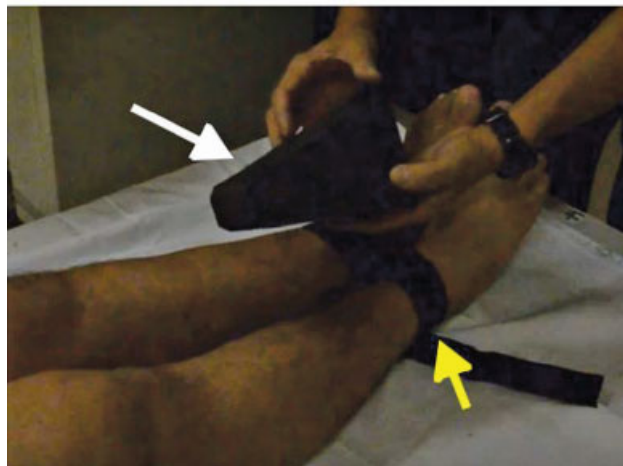
Fig. 2 Após a colocação da fita de Velcro (setas amarelas) em volta dos tornozelos à altura supramaleolar, a atenção é dedicada à aplicação do estresse em varo no joelho. O triângulo de espuma (setas brancas), feito com etileno acetato de vinila, é colocado entre os joelhos. É importante assegurar o posicionamento da base do triângulo à altura da tuberosidade tibial e da ponta do triângulo à altura do fêmur distal.